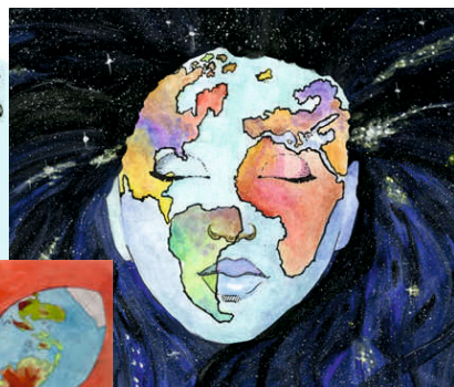
Tóth V.: Földanya (14 éves, Sopron, 2017)