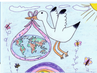
Papp A.: Globalizáció - megérkezett az új generáció! (8 éves, Budapest, 2009)