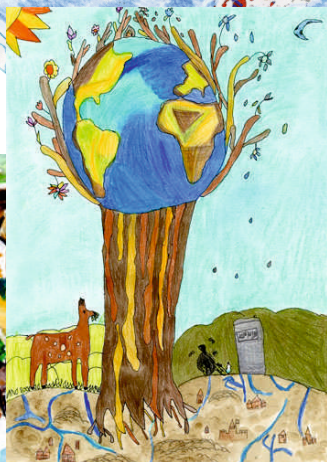
Kurucs L.: A képzeletem (7 éves, Budapest, 2019)