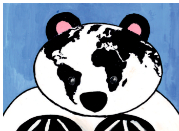
Fink G. - Viszti Gy.: Őrizzük meg a Földet a jövő nemzedéke számára! (12 évesek, Tamási, 2003)

https://mercator.elte.hu/icadij és https://facebook.com/elte.lazarus/